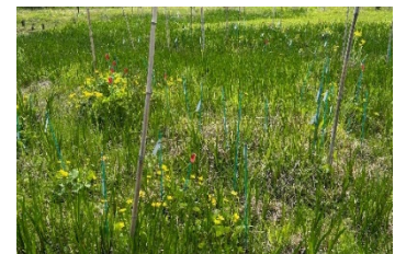
丸池に生息しているリュウキンカ

丸池は、地域を代表する自然資源の一つであり、湧水生態系や希少な動植物の生息・生育環境として重要な役割を果たしています。長年にわたり、町や地域住民による継続的な保全が行われてきましたが、近年は気候変動等の影響により湧水が減少し、リュウキンカを含む生態系は危機的な状況に直面しています。